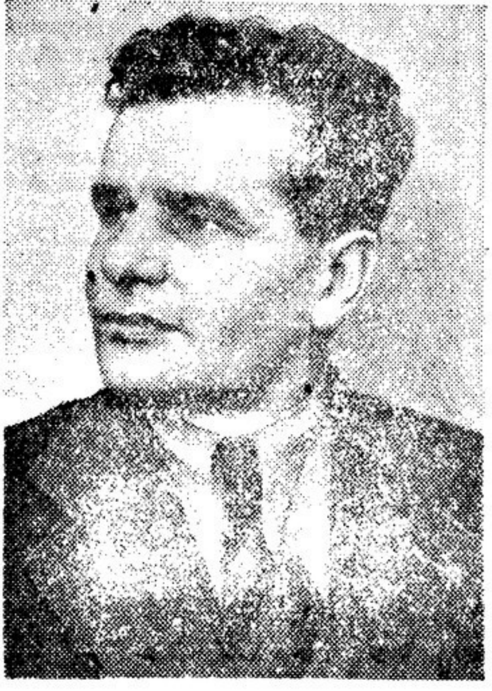
Ф. И. ПАНФЕРОВ