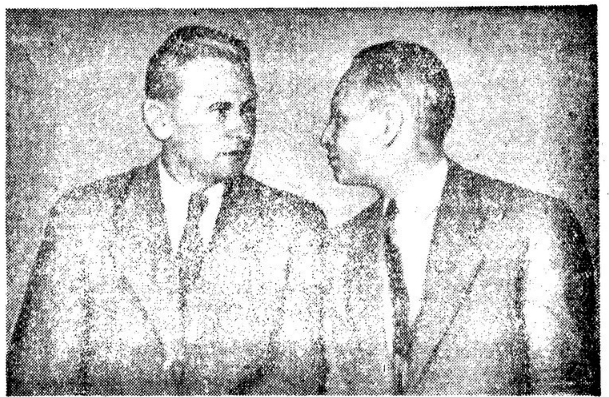
А. Фадеев и Луи Арагон на Всемирном конгрессе сторонников мира в Париже.